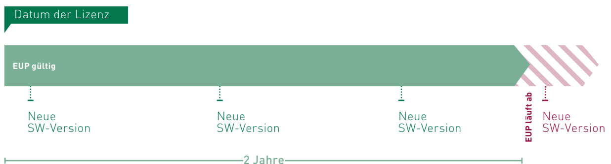
Abb. 1: Die iba-Software-Wartung ist in den ersten zwei Jahren nach Erwerb der Lizenz kostenfrei.